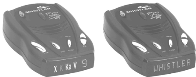
Whistler Pro 73